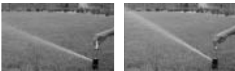
Trjectory™ (Réglage de la trajectoire et de la portée)

La turbine TR70XT utilise le système très simple de réglage du secteur par bague tournante identique au TR50XT. Il est conçu pour supporter les pressions élevées rencontrées sur les installations collectives tels que les terrains de sports. Disposant de tous les avantages y compris du clapet de fermeture X-Flow® et de la trajectoire réglable du jet. Tout les réglages sont protégés par un couvercle en caoutchouc épais.