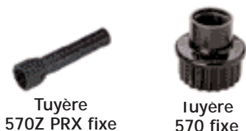
Tuyère 570Z PRX fixe

S'utilise avec toutes les buses MPR, secteur réglable, jets dirigés, bubbler, ou Maxijet.® Prévu pour l'arrosage des arbustes et plantes tapissantes dans les zones non concernées par le vandalisme. Compatible avec toutes les buses et filtres de la série 570Z.