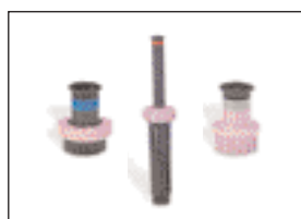
Indicateur de couleur mauve signalant l'utilisation d'eau recyclée (Réf. N° 89-9752)