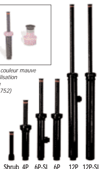
Shrub 4P 6P-SI 6P 12P 12P-SI